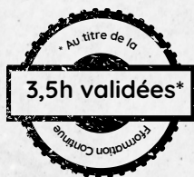
Table ronde 1 - Actualité, Procédure Civile et Politique de l'Amiable

(!) L'émargement aura lieu de 9h à 10h30.